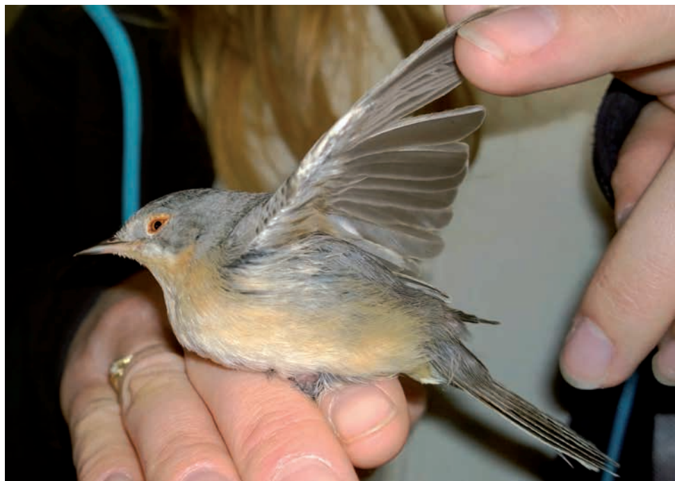
Obr. 8 – Pěnice vousatá ( Sylvia cantillans) odchytená do sítě při kroužkování v rámci projektu RAS na rybníce Velký Potočný u obce Kestřany na Písecku, první zjištění druhu v České republice.

Fig. 7 – Adult of European Bee-eater ( Merops apiaster) with freshly fledged juvenile in sandpit near Třebeč village in České Budějovice district.