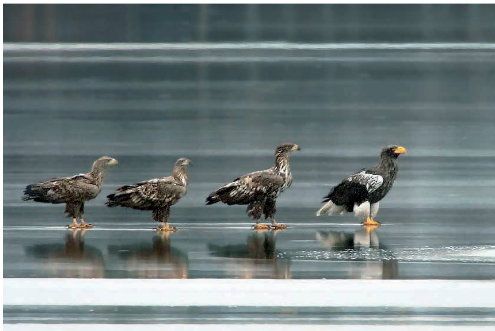
Obr. 6 – Subadultní orel východní ( Haliaeetus pelagicus) se třemi mladými orly mořskými ( Haliaeetus albicilla) na rybníce Velký Tisý.

Fig. 5 – Adult Squacco Heron ( Ardeola ralloides) at Nový Vrbenský pond.