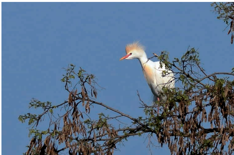
Obr. 2 – Volavka rusohlavá ( Bubulcus ibis) v hnízdním šatě (růžový kořen zobáku) na ostrůvku Nového Vrbenského rybníka, zřejmě na svém budoucím hnízdišti.

Fig. 1 – One of the four Cattle Egrets ( Bubulcus ibis) foraging nearby cattle on the pasture next to Zajícovský pond near České Budějovice town.