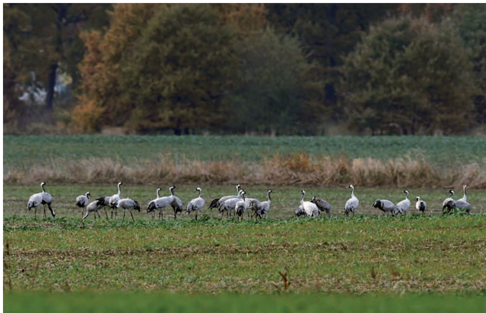
Obr. 3 – Část hejna asi 80 jeřábů popelavých ( Grus grus), zastižených při sběru potravy mezi NPR Velký a Malý Tisý a Lomnicí nad Lužnicí.

Fig. 3 – Part of the 80 individuals flock of Common Crane ( Grus grus) feeding between Velký a Malý Tisý National Nature Reserve and Lomnice nad Lužnicí town.