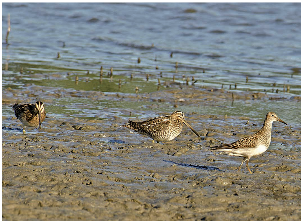
Obr. 4 – Mladý jespák skvrnitý ( Calidris melanotos) při sběru potravy se dvěma bekasinami otavními ( Gallinago gallinago) na Knížecím rybníce.

Fig. 3 – Part of the 80 individuals flock of Common Crane ( Grus grus) feeding between Velký a Malý Tisý National Nature Reserve and Lomnice nad Lužnicí town.