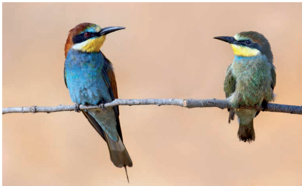
Obr. 7 – Dospělá vlha pestrá ( Merops apiaster) s čerstvě vzletným mládětem v pískovně u Třebče na Českobudějovicku.

Fig. 7 – Adult of European Bee-eater ( Merops apiaster) with freshly fledged juvenile in sandpit near Třebeč village in České Budějovice district.