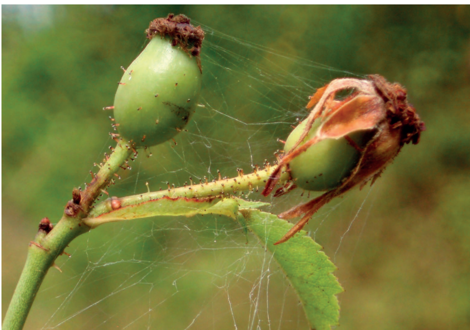
Obr. 4 – Rosa micrantha , Čkyňské vápence, návrší Na opukách u Zechovic.

Fig. 3 – Lythrum hyssopifolia , Novohradské podhůří, exposed bottom of Milíkovický pond.