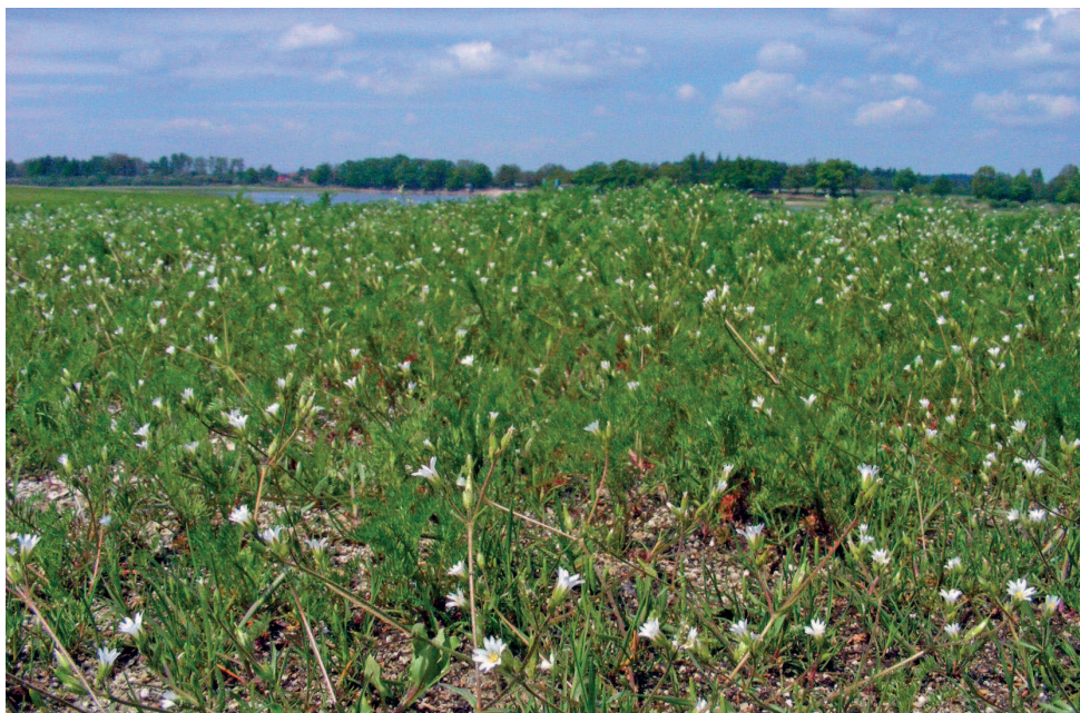
Obr. 1 – Porost rožce pochybného ( Cerastium dubium ) a myšího ocásku nejmenšího ( Myosurus minimus ) na obnaženém dně rybníka Žár, Třeboňská pánev.

Fig. 1 – Vegetation with dominant Cerastium dubium and Myosurus minimus at temporarily exposed bottom of Žár pond, Třeboňská pánev.