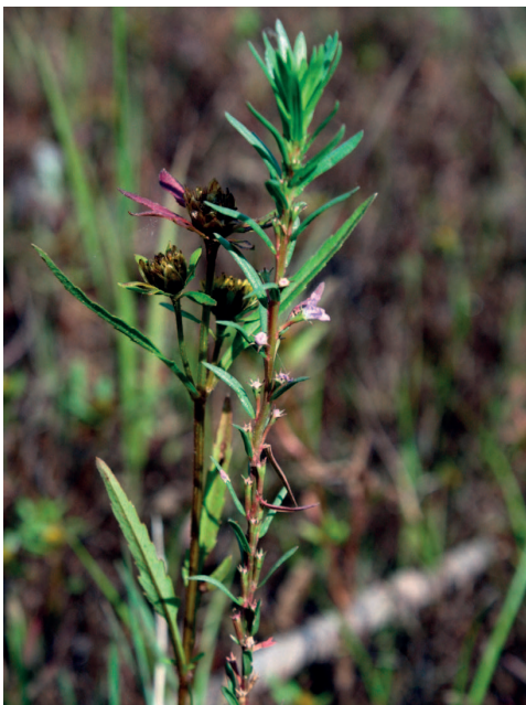
Obr. 3 – Lythrum hyssopifolia , Novohradské podhůří, obnažené dno Milíkovického rybníka (foto M. Štech 2014).

Fig. 3 – Lythrum hyssopifolia , Novohradské podhůří, exposed bottom of Milíkovický pond (photo by M. Štech 2014).