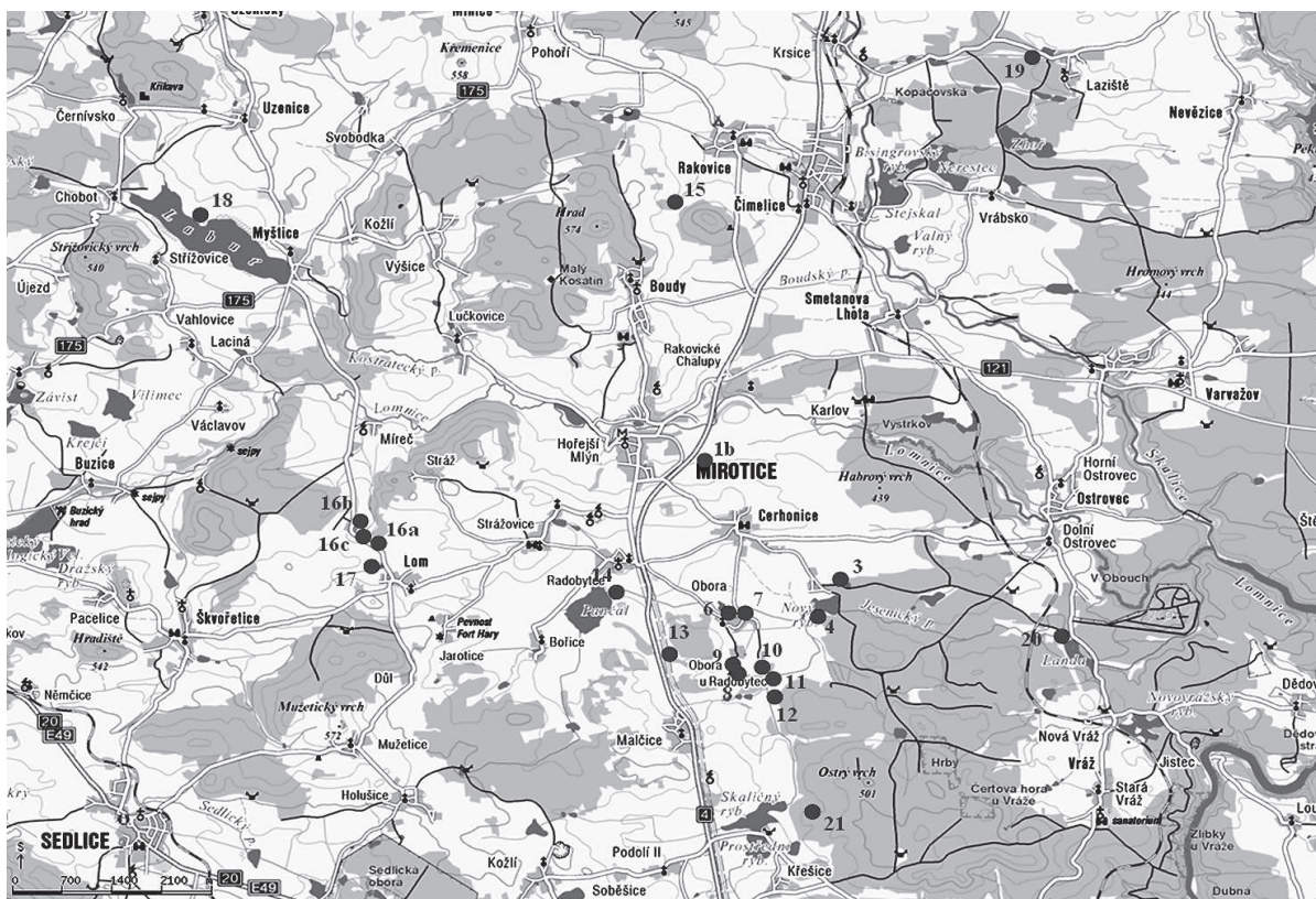
Obr. 1 – Širší okolí Mirotic, lokality č. 1b, 3, 4, 6–21.