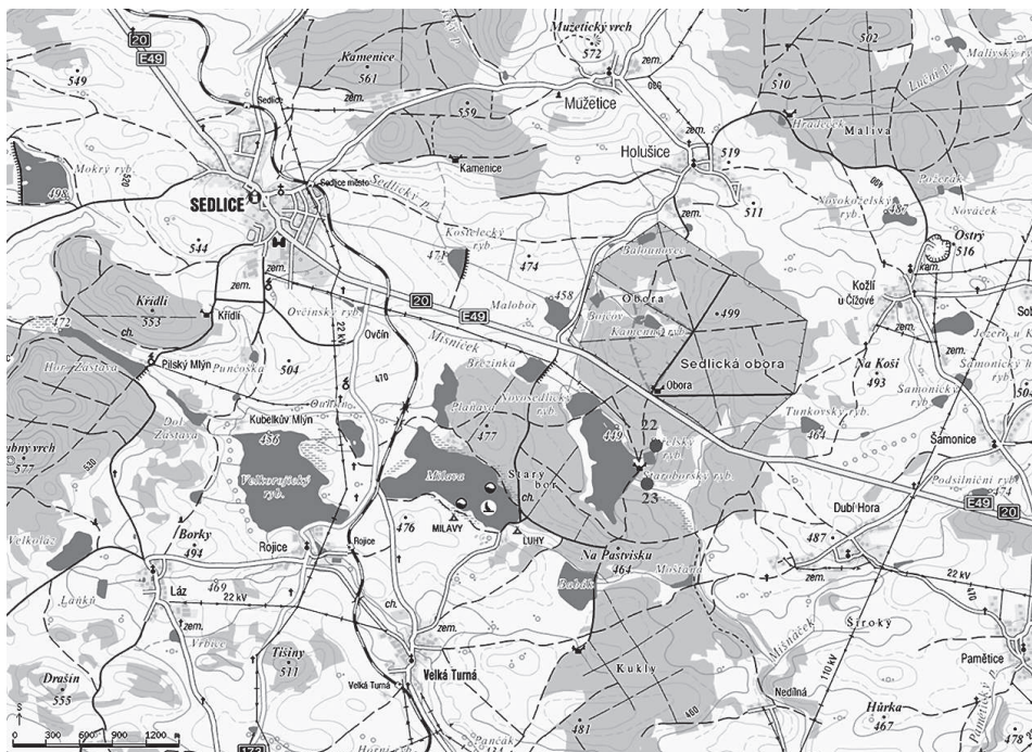
Obr. 3 – Sedlice, Staroborský rybník, lokality č. 22 a 23.