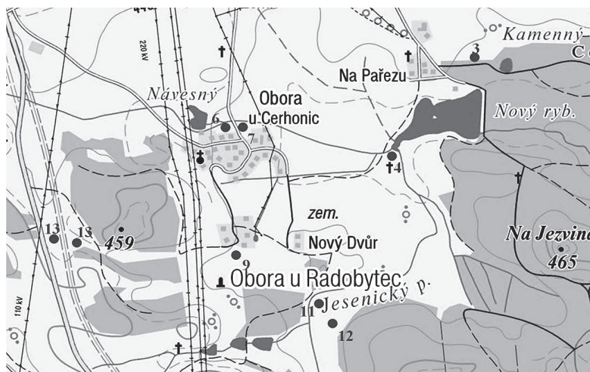
Obr. 2 – Obora u Cerhonic, lokality č. 3, 4, 6, 7, 9, 11–13.