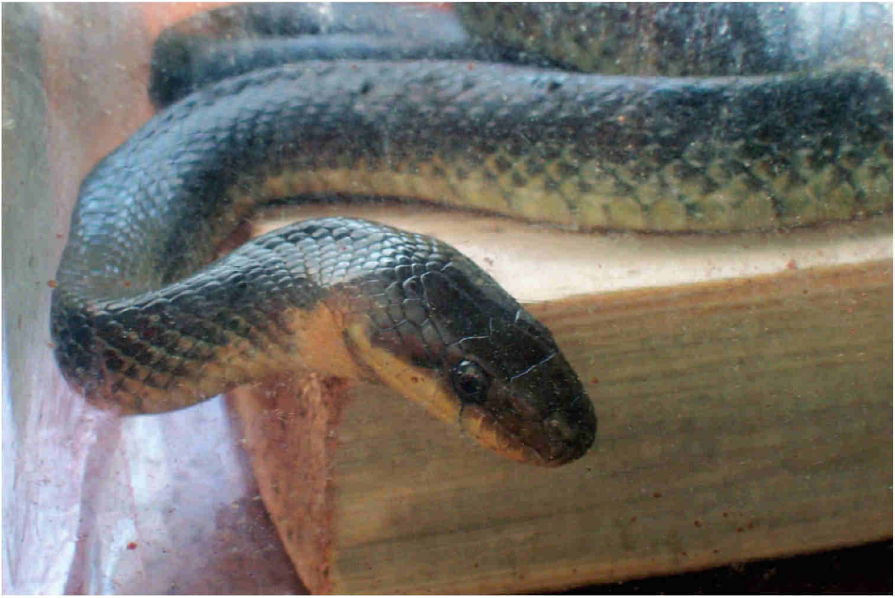
Obr. 1 – Exmplář užovky stromové ( Zamenis longissimus ) z Volar.