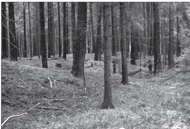
Obr. 3.: Haldy vykopané zeminy na pravém břehu Nové řeky, asi na 9,5 km jejího toku.