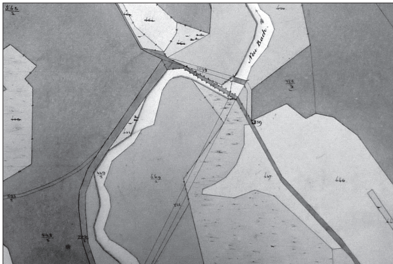
Obr. 6.: Detail katastrální mapy z let 1827 až 1873, Třeboň; Holičky u Staré Hlíny. Je na ní původní Dlouhý most a zakres projektovaného zkrácení toku Nové řeky s novým krátkým mostem.