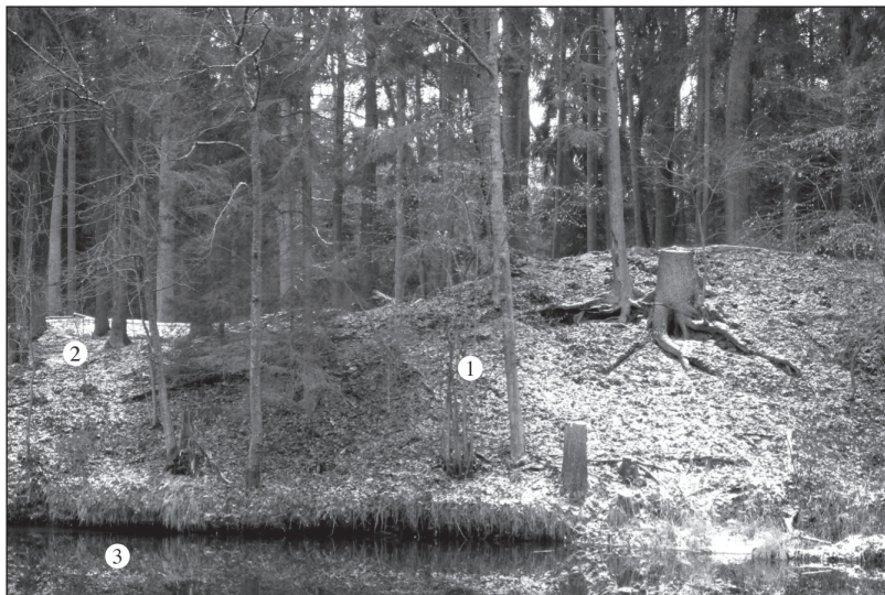
Obr. 2.: Prokopaná vysoká hráz (1) bývalého rybníka Krásné pole. Cesta po nízké říční hrázi (2). Tok Nové řeky (3).