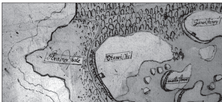
Obr. 5.: Detail mapy z roku 1667, na které je zakreslena prázdná nezalesněná plocha nazvaná Krásné pole.