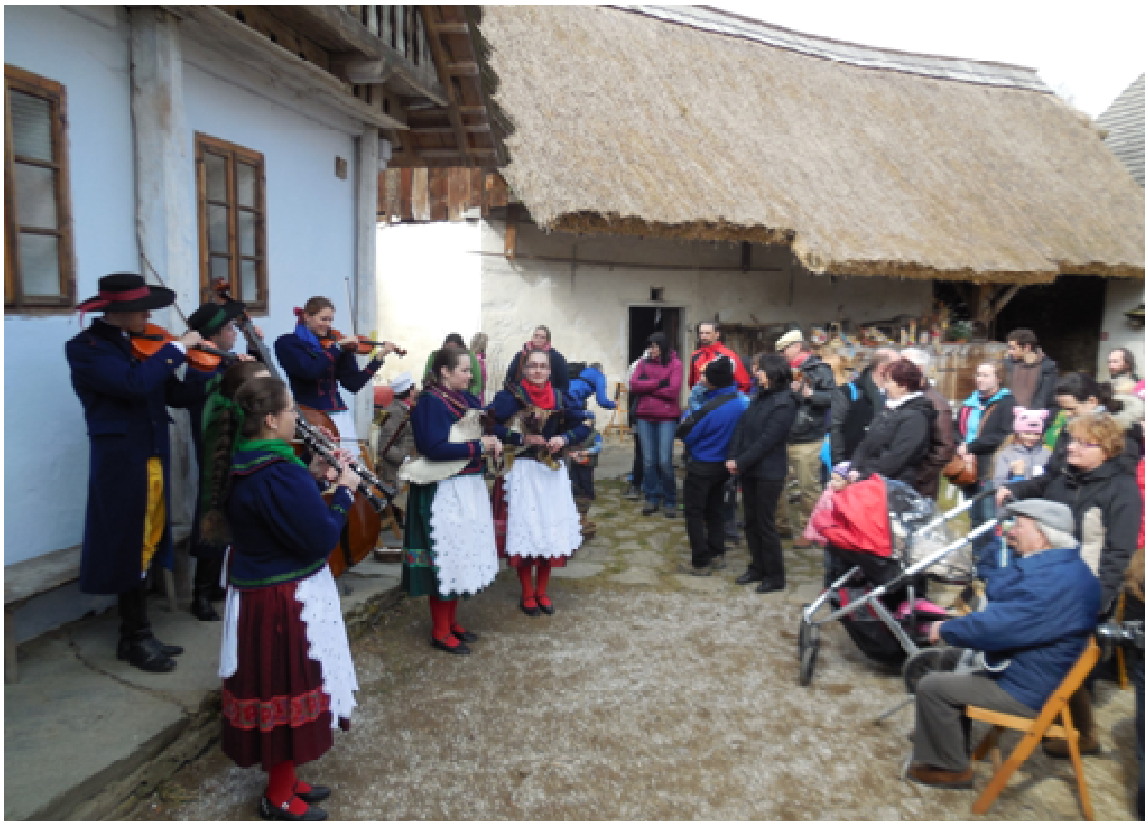
Mladá dudácká muzika v Hoslovickém mlýně